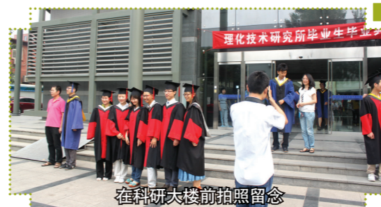
在科研大楼前拍照留念