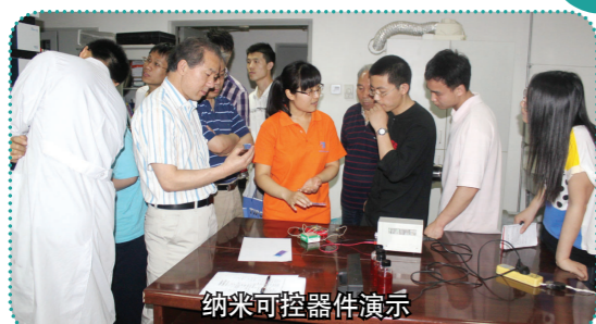
纳米可控器件演示