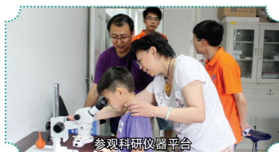
参观科研仪器平台