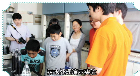
污水处理演示实验