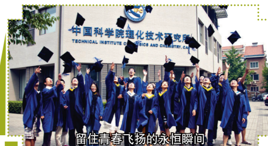
留住青春飞扬的永恒瞬间