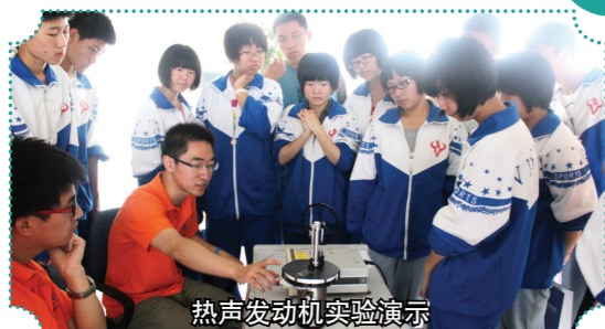
热声发动机实验演示