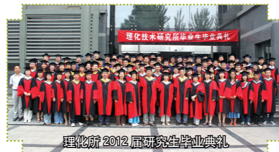
理化所 2012 届研究生毕业典礼