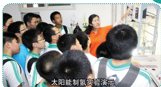
太阳能制氢实验演示