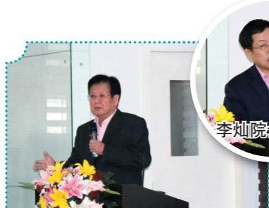
首席科学家陈创天院士作报告