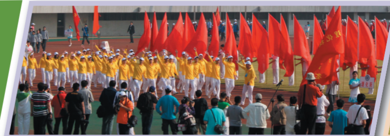
理化所代表队在入场式上意气风发地经过主席台