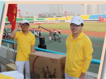
抽得一等奖的幸运观众